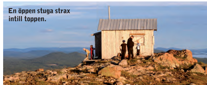
En öppen stuga strax intill toppen.

Utsikt: Vy över Uddjaur som breder ut sig med sitt skärgårdslandskap med alla holmar. Närmaste bebyggelse är Mellanström och Kasker söder och sydväst om toppen. På samiska betyder veälbmá stillaflytande vatten, ett sel, möjligen med mycket grönska omkring. Buovdda betyder "kal hjässa". Från toppens norra sida syns Hornavan och i nordvästlig riktning gränsfjällen i Norge.