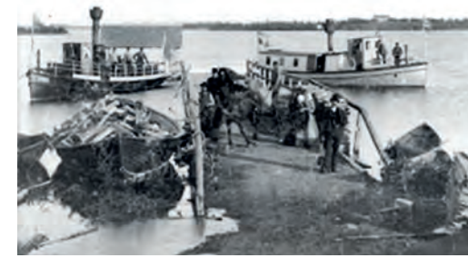
Båttrafik var en gång i tiden livlig på Uddjaure, liksom flottning.

under 1960-talet då tornet blåste ner. Veälbmåbuovdda var ett populärt utflyktsmål, inte minst under sommarens helger. Lästips: Mullholm – mitt i Lappland av Lise-Lotte B Modig (2006).