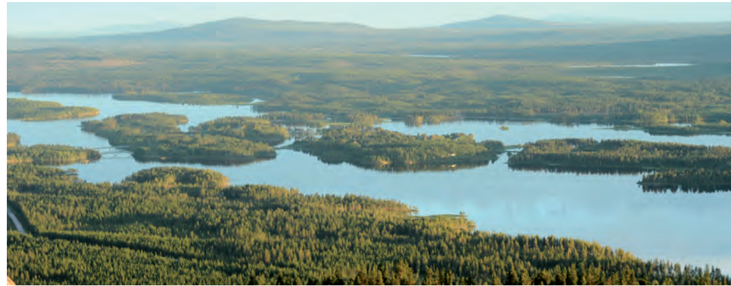
Veälbma, vid Uddjaures sydöstra hörn, möter Dväljan, Storavan, vid Mellanströms broar.

Serien med utflyktsguider utges av Arjeplogs kommun med statligt stöd till lokala naturvårdsprojekt (LONA) förmedlade av Länsstyrelsen i Norrbotten. Använd gärna fjällkartan för att planera dina utfärder: www.kso2.lantmateriet.se . Guiderna finns här för nedladdning: www.arjeplog.se/utflyktsguider . Arjeplogs kommun © Lantmateriet, Geodatasamerkan.