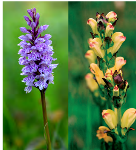
Vid trädgränsen växer orkidén Jungfru Marie nycklar Dactylorhiza maculata och Kung Karls spira Pedicularis sceptrum-carolinum .