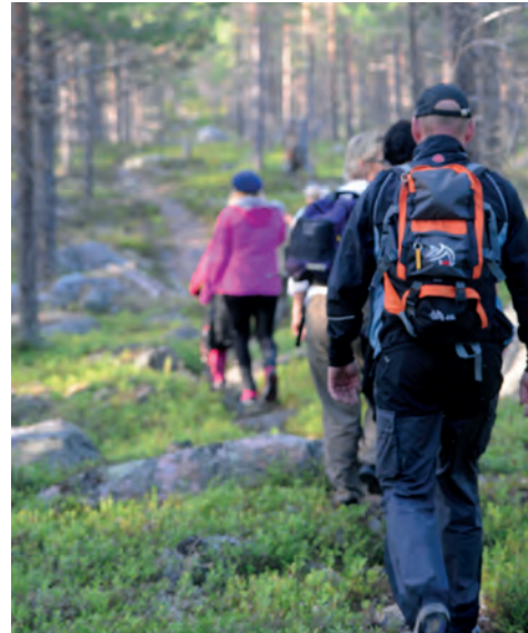
Stigen börjar i tallskog. Efter en kilometer börjar stigningen. I det brantaste partiet finns en del grus och småstenar.

Natur: Från startpunktens tallskog med blåbär, lingon och kråkbär, där det har skett omfattande avverkningar och planteringar, till naturskog med spår av äldre plockhuggningar närmast toppen. Vid trädgränsen finns ett mindre myrområde där orkidén jungfru Marie Nycklar växer och därefter följer fjällhed med ris och viden. Vid toppstugan samsas hållmarker och block med dvärgbjörk och lappljung".