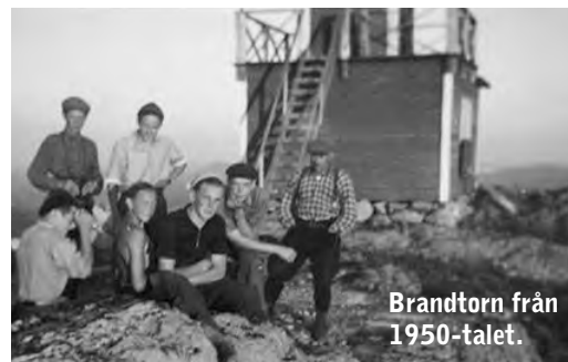
Brandtorn från 1950-talet.

En glimt historia: Innan körbara vägar byggdes skedde de flesta transporterna längs sjösystemen. Redan på 900-talet gick en handelsled mellan Arjeplog och norska kusten. Bland äldre leder finns de som upprättades i anslutning till verksamheten vid Nasafjälls gruva på 1600- och 1700-talen. Man kan ännu idag träffa på kavelbroar från den tiden. De flesta transporter skedde dock vintertid på frusna sjöar och myrar. Kring Uddjaures stränder kom några av Arjeplog kommuns första nybyggare i slutet av 1600-talet, många av samisk härkomst. I början av 1900-talet byggdes ett brandbevakningstorn på toppen. Sommartid fanns personal på plats. Verksamheten upphörde