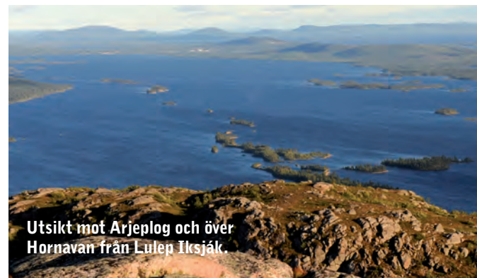
Utsikt mot Arjeplog och över Hornavan från Lulep Iksjåk.