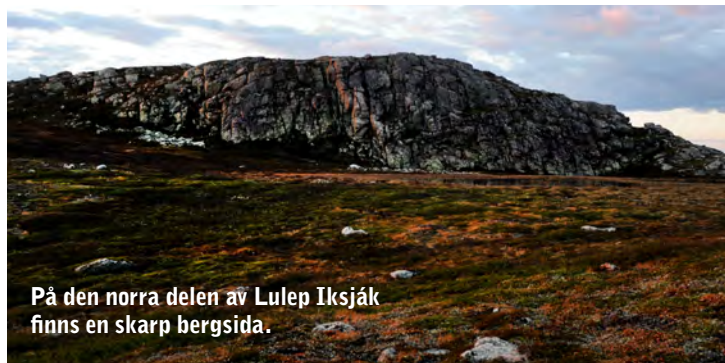
På den norra delen av Lulep Iksjåk finns en skarp bergsida.

Området på toppen bjuder på spännande formationer. Inlandsisen smälte, bröt fram och slipade till fjällkedjan med enorm kraft. På Lulep Iksjåk finns en skarp bergssida som är i ständig förändring. Det är frostsprängning, vilket är vanligt i kalla regioner och högfjällsområden. Det är vatten som trängt in i sprickor och som utvidgas vid övergång till is. När vattnet fryser till is blir det nio procent 'större'. Om man tar en bild av fjälltoppen nu och en till om femtio år går det sannolikt att se förändringen. Även växtligheten kan förändra karaktär. Vad som sker i ett längre tidsperspektiv är oklart, men vissa prognoser antar att trädgränsen förflyttas uppåt i höjddet och att andelen kalfjäll kommer att minska till följd av ett ändrat klimat. Samtidigt har även andra faktorer som bete, markens näringsstatus och tidigare markanvändning en viktig inverkan på träd- och skogsgränsens utbredning.