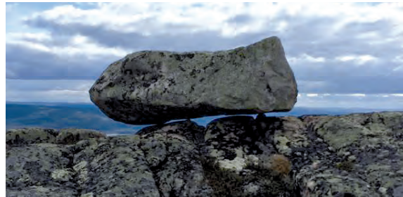
Intill toppen av Alep Iksjåk finns en s.k. "liggande höna", ett stenblock på tre små stenar. Ett verk av inlandsisen.

Fåglar: I området finns kungsörn och fjällvråk, men det är mer vanligt se lavskrika, ljunpipare eller fjällpipare. Andra arter som förekommer i växlande antal är bergfink, blåhake, dalripa, gråsiska, lövsångare, rödstjört och rödvingetrast.