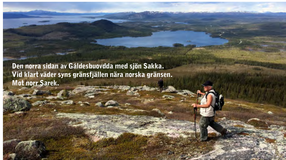
Den norra sidan av Gáldesbuovdda med sjön Sakka. Vid klart väder syns gränsfjällen nära norska gränsen. Mot norr Sarek.

Serien med utflyktsguider utges av Arjeplogs kommun med statligt stöd till lokala naturvårdsprojekt (LONA) förmedlade av Länsstyrelsen i Norrbotten. Använd gärna fjällkartan för att planera dina utfärder: www.kso2.lantmateriet.se . Guiderna finns här för nedladdning: www.arjeplog.se/utflyktsguider . Arjeplogs kommun © Lantmateriet, Geodatasamerkan.