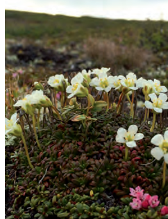
Fjällgröna Diapensia lapponica