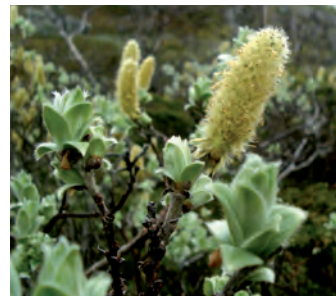
Gråvide Salix cinerea