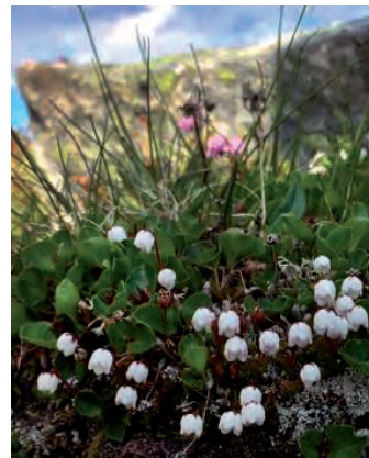
Mossljung Parnassia palustris