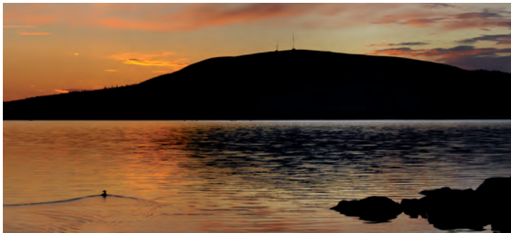
Gáldesbuovdda med sitt naturreservat. Under vintern finns här en är skidanläggningen, husvagnsplatser och hotell.

Skydd: Finns inget på toppen, men intill en parkeringsplats – 200 m längre ned efter den asfalterade vägen – finns en stor raststuga och sittplatser. På en informationstavla presenteras Galtispuoda naturreservat.