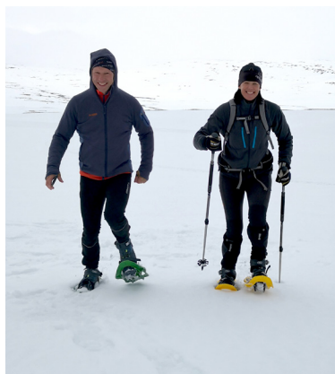
Snön kan ligga länge i fjällområdet. Här från Själbmåtjåhkkå den 8 maj – med snöskor.