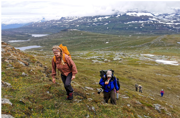
Stigen fortsätter vidare mot Norge, den fria vandringen mot toppen av Själbmåttjähkkä sker i sydlig riktning. Följ fjällryggen.

Serien med utflyktsguider 2020 utges av Arjeplogs kommun i samarbete med Top of Arjeplog. Statliga bidrag till lokala naturvårdsprojekt (LONA) är medfinansierat. Arjeplogs kommun © Lantmäteriet, Geodatasamverkan. Kartunderlag från Lantmäteriets fjällkarta www.kso.etjanster.lantmateriet.se . Använd gärna denna sida för att planera utfärder. Guiderna finns här: www.arjeplog.se , www.arjeploglapland.se och www.topofarjeplog.org .