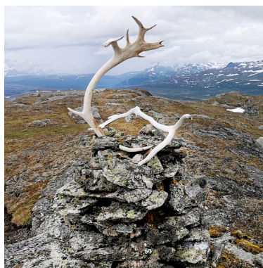
Röse på toppen 1 061 m ö.h.