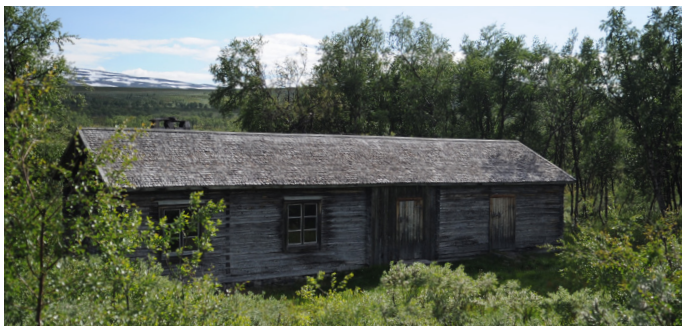
150 år gammal. En vilstuga med stall med många berättelser.

Källor: www.arjeplognytt.se/2020/07/22/krigshistoria-vid-statens-vilstuga/ och Norrbottens kulturmiljöprogram 2010-2020 (Länsstyrelsen BD).