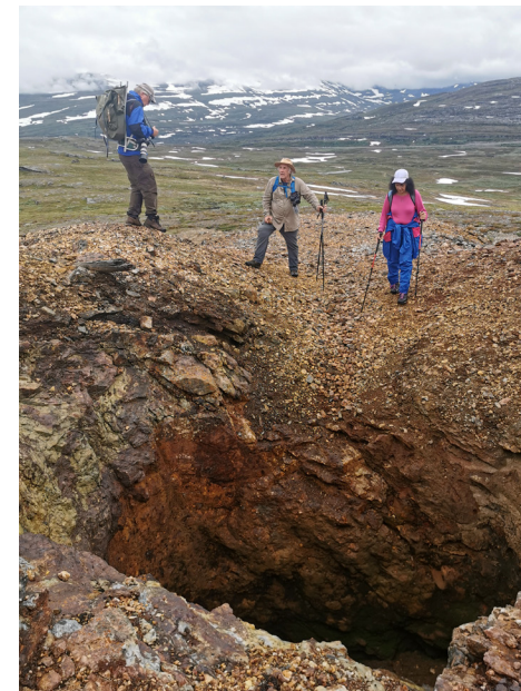
Lämningar av koboltgruvan som utgörs av sex gropar varav två numera är vattenfyllda i ett område som är ca 200 x 60 meter.

Källor: Kurt Carlman (barnbarn till PerAugust Carlman) och Sveriges geologiska undersökning, SGU.