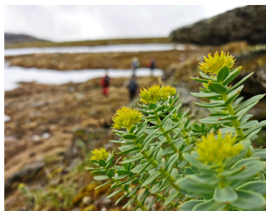
Rosenrot ( Rhodiola rosea )

Fåglar: Ljungpipare, ripa, fjällabb, fjällpipa är mest vanliga. Bland rovfåglar kan det vara möjligt se havsörn, kungsörn, pilgrimsfalk, stenfalk och jaktfalk. Men det gäller att ha litet extra tid och hålla sig stilla. Ta gärna med en kikare.