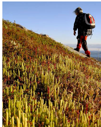
Fjällumner (Lycopodium alpinum)