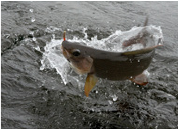
Harr i Piteälven.

Måffe är en bra utsiktspunkt till fiskeriket Piteälvområdet. Från toppen kan man se över sjöar och vattendrag som har mycket att erbjuda den fiskeintresserade. Här finns många sorter – inte minst röding, öring, gädda, sik, abborre. Dock är harr karaktärsfisken för området. Vana fiskare beskriver att harren bäst kommer till sin rätt på flugspö eller lätt haspelutrustning. Strömmarna mellan Skierfjåvrrer och Sådåjåvrrer – med Åbbmofallet – beskrivs som särskilt fina fiskevatten, där det förutom harr också finns en storvuxen stam av öring. Längs Piteälven och dess nära vattendrag finns spår av gamla flottningsleder. Det var ju längs vattnet som timret fraktades i början av 1900-talet. Arbetet med att återställa miljön i dessa vattendrag pågår på flera håll. Pite älv ekonomisk förening har ett av många miljöåterställningsprojekt. Ett flertal vandringshinder för fisk har undanröjts.