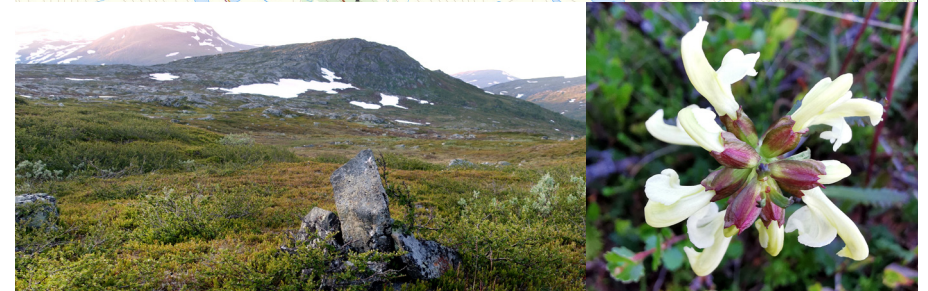
Jurunvárátj – en topp med vida vyer i sällskap med många växter, som här, lappspira.