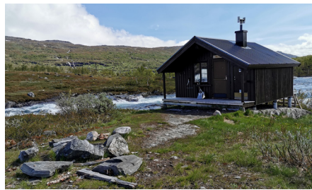
Raststuga vid Selduttjåhkå.

Glaciärisvatten. Från toppen av Jurunvárátj kan man blicka ned på den kraftfulla älven från Jurunjávrr som förbinds med andra sjöar. Ikkesjávrrer hör till de större. Ibland skiftar vattnets färg i grönt vilket ofta hör ihop med glaciärer. Den här vandringen sker ovanför trädgånsen med start på 723 m ö.h. De gröna områdena på kartan vinner allt större terräng. Gränsen till fjälltundran sammanfaller i stort sett med trädgränsen som ligger på närmare 900 m ö.h. i de södra fjällen och på omkring 600 m ö.h. i de nordvästra delarna av fjällkedjan. För de som vistas mycket i fjällen är det ingen nyhet att nedsmältningen av is och snö har ökat. Växtligheten förändras och man brukar prata om en "förbuskning". Flera värmeälskande djurarter sprids norrut, som till exempel rådjur. Sedan nittio-talets början har en tydlig uppvärmning ägt rum jämfört med normalperioden 1961–1990.