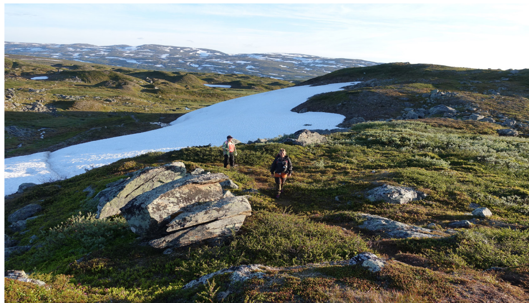
Vy en kilometer efter starten vid Guoledis med sikte på Jurunvärátj. Bilden är från 23 juli och snöfläckar ligger kvar här och var. Området är rikt på fornlämningar som framför allt Silvermuseets arkeologer inventerat såsom visten, hädar, förvar (oftas gropar) och sk stalotomter.