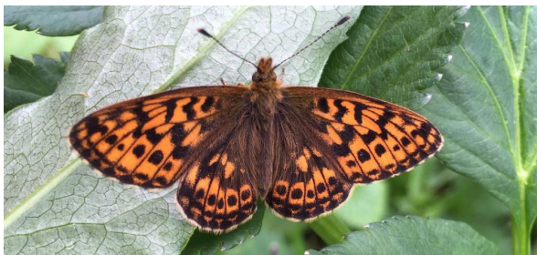
Bäckpärlormorfjäril, en ovanlig art. 2016.

Kolla in fjärilar! I Sverige finns mer än hundra olika arter av dagfjärilar och självklart även i fjällen. För att få syn på dem är det viktigt att gå ut vid rätt tillfälle; helst en solig och varm dag och under första delen av juli.