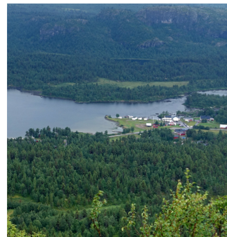
Bostäder och turistanläggningar i Gautosjö.