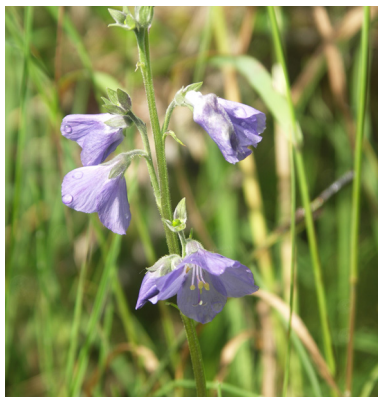
Lappblågull ( Polemonium caeruleum )