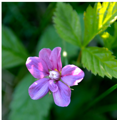
Åkerbär ( Rubus arcticus )