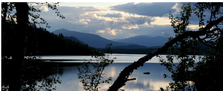
Gautosjön / Gávttöjåvrre från stigen till Märkforsen.

Källa och lästips: Marianne Hofman & Erland Segerstedt, En skvätt om Arjeplog (2017). Tio år med floran i Pite Lappmark , utgiven av Föreningen Pite lappmarks flora (2019).